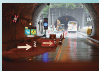
共同溝、洞道、工事現場