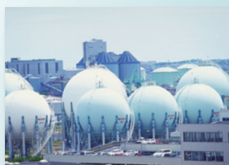
石油精製工場/ 石油化学基礎製品工場