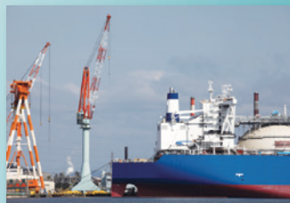
船舶、オフショア設備